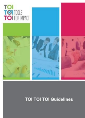
Abb. 3: Titelblatt der "TOI TOI TOI Guidelines"

Wie bereits erwähnt, wurden die TOI TOI TOI Guidelines (siehe Abbildung 3) auf der Abschlusskonferenz vorgestellt. Diese 70-seitige Broschüre enthält alle relevanten Informationen über das Projekt, macht Vorschläge, wie ein Projekt-Konsortium geplant werden kann und stellt schließlich einige erfolgreiche EU-Projekte vor. Die Guidelines werden in allen Partnersprachen sowie auf englisch verfügbar sein und können von der Projekt-Webseite unter www.toitoitoi.eu kostenlos heruntergeladen werden.