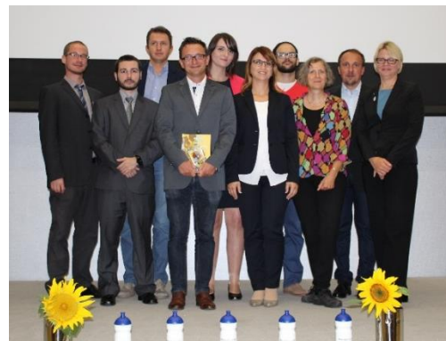
Abb. 4: Das Projekt-Team nach der Abschlusskonferenz

Der Projekt-Koordinator möchte allen Team-Mitgliedern für ihre professionelle Arbeit und ihre herzliche Freundschaft in den vergangenen zwei Jahren danken.