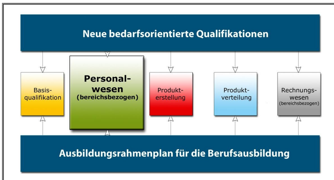
Abbildung 3: Modulsystem des Berufsbildes Kauffrau / Kaufmann für Bürokommunikation

Die Modularisierung einzelner Berufsbilder erfolgt ausgerichtet an der betrieblichen Realität wiederum in enger Kooperation zwischen Bildungsdienstleister und Unternehmen. Auf der Grundlage einer Analyse der betrieblichen Gegebenheiten werden relevante Handlungssituationen des Berufsfeldes im Unternehmen identifiziert und orientiert an konkreten betrieblichen Tätigkeitsfeldern zu Modulen gebündelt. Ausbildungsinhalte aus dem Ausbildungsrahmenplan werden also nicht nach einer vorgegebenen Fachsystematik zu Lerneinheiten zusammengefasst, sondern so gestaltet, wie sie als Einsatzbereiche von Mitarbeitern im betrieblichen Zusammenhang vorkommen und den Teilnehmern bekannt sind. Ein Mitarbeiter, der ein Modul durchlaufen hat, ist folglich für das entsprechende Aufgabengebiet im Unternehmen qualifiziert. Indem ein Mitarbeiter alle Module durchläuft, kann er bis hin zum Berufsabschluss geführt werden. Im Rahmen von Modellprojekten wurde bereits eine ganze Reihe von Berufsbildern modularisiert, die Modulsysteme sind überwiegend gut dokumentiert und frei verfügbar. Bei Bedarf kann jedes Berufsbild modularisiert werden.