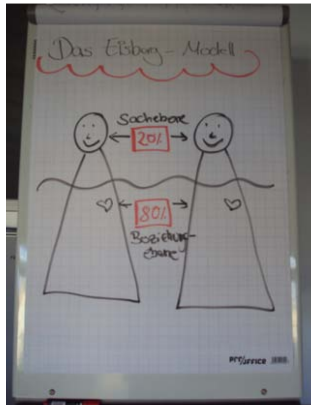
Flipchart aus dem Qualifizierungsmodul „Kommunikation und Gesprächsführung“