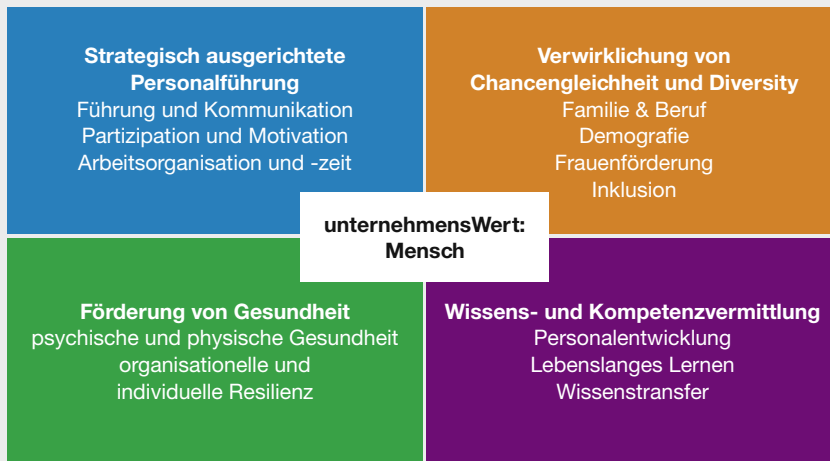
Abb. 1: Die vier Handlungsfelder des Programms

Träger und Stiftungen setzen sich gemeinsam für mehr Arbeitsqualität in Unternehmen ein. Ziel ist es, Arbeitsbedingungen so zu gestalten, dass die Arbeitsbelastung gering gehalten sowie die Motivation gefördert wird. Hierzu wurden Beispiele guter Praxis identifiziert und Analyse- und Steuerungsinstrumente für die Unternehmensführung erarbeitet. Interessierte können sich über die Initiative auf dem Internetportal www.inqa.de informieren. Anders als die Initiative Neue Qualität der Arbeit richtet sich das Programm unternehmensWert: Mensch ausschließlich an KMU. Auch der Einsatz von Fachberatungen geht über das bisherige Angebot der Initiative hinaus.