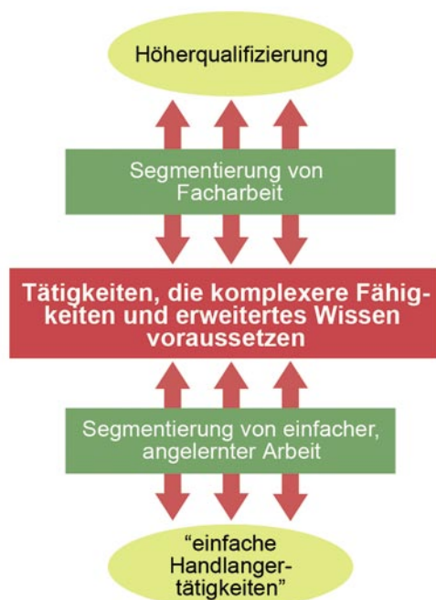
Segmentierung von Arbeit: Druck auf die Facharbeit?

Die Beiträge dieser Ausgabe befassen sich mit dem Bereich der einfachen Arbeit an der Schnittstelle zur Facharbeit. In der berufspädagogischen Diskussion spielt dieser Beschäftigungsbereich noch immer eine kaum wahrnehmbare Rolle. Einfache Tätigkeiten – so wird unterstellt – werden zunehmend verschwinden, und damit auch die für sie geforderten Qualifikationen.