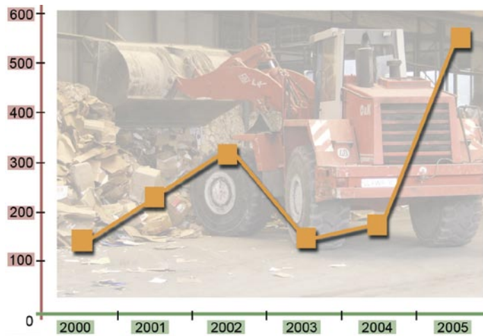
Stellen für An- und Ungelernte in der Entsorgungswirtschaft

Wenn also künftig auf der einen Seite die Anforderungen steigen, auf der anderen Seite aber die dreijährige Berufsausbildung zu komplex und umfassend für die Betriebe ist, muss gefragt werden, inwieweit die große und in den letzten Jahren anteilmäßig stabil gebliebene Gruppe der An- und Ungelernten in diesem Bereich den künftigen Anforderungen gewachsen sein wird. Zur Aufklärung dieser Frage wäre