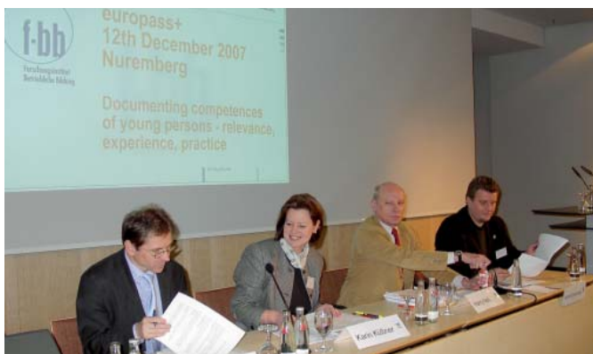
Podiumsdiskussion im Rahmen des europass+-Workshops am 12.12.2007 in Nürnberg im Kongressprogramm der „Berufsbildung 2007“.

Das entwickelte Online-Unterstützungsinstrument bietet für die bereits im Europass-Lebenslauf festgeschriebenen Kategorien konkrete Definitionen, Unterkategorien und Deskriptoren an und erläutert sie durch Praxisbeispiele. Der Nutzer des Instruments findet Beispiele aus Arbeit und Freizeit und kann vor diesem Hintergrund die Ergebnisse seines informellen Lernens bewerten und online dokumentieren. Die eingegebenen Daten können dann als Worddokument heruntergeladen und in den Europass-Lebenslauf integriert werden. Das im