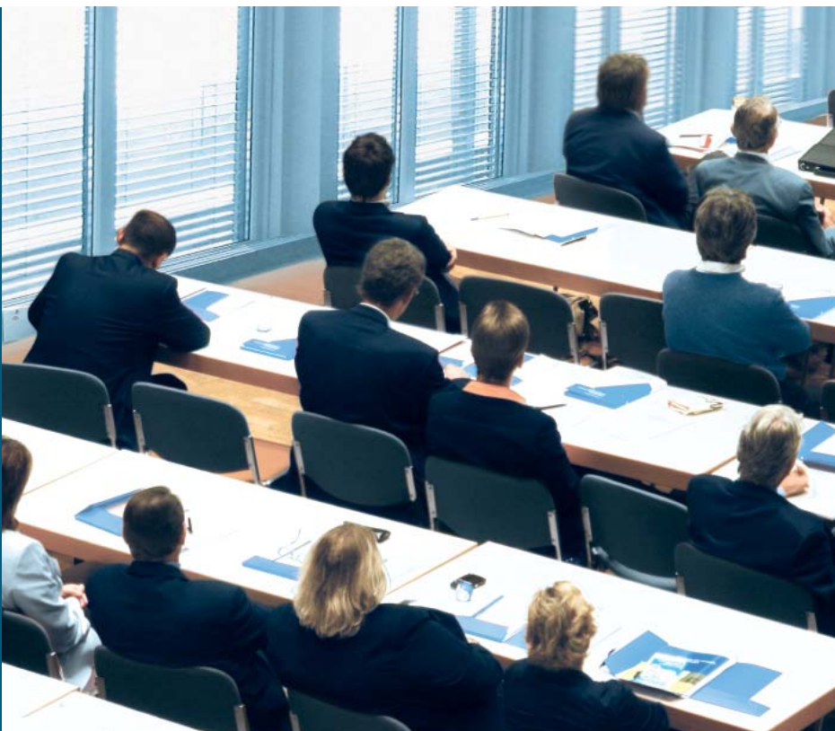
Tagung zur „Europäisierung der Berufsbildung“ am 13. Dezember 2007 im Kongressprogramm der „Berufsbildung 2007“ in Nürnberg.

3 Europäische Initiativen zur Förderung von Transparenz, Vergleichbarkeit und Mobilität in der beruflichen Bildung stoßen auf breite Akzeptanz, rufen aber auch Befürchtungen und kritische Nachfragen hervor: Gelingt es, die Qualität der deutschen dualen Ausbildung im internationalen Vergleich angemessen zur Geltung zu bringen? Und: „Reformiert die EU jetzt die deutsche Berufsbildung?“ (wie es Michael Schopf einmal in bewusster Überspitzung ausgedrückt hat). Grund genug, am 13. November 2007 in Nürnberg parallel zur Messe „Berufsbildung 2007“ umfassend über das Thema zu informieren. Die Fachtagung „Europäisierung der Berufsbildung – ECVET, EQR und DQR in der Diskussion“ wurde von Herbert Loebe, dem Hauptgeschäftsführer des Bildungswerks der Bayerischen Wirtschaft, mit einem Vortrag über die Europäisierung der Berufsbildung und ihre