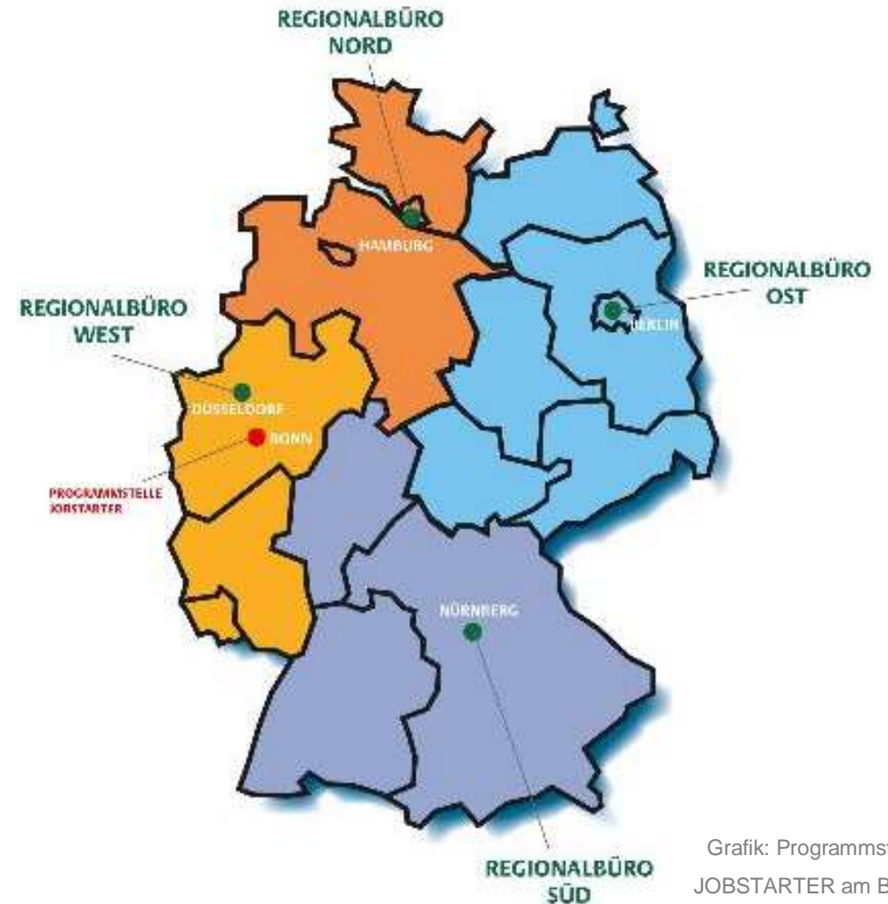
Grafik: Programmstelle JOBSTARTER am BIBB